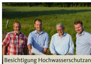
Besichtigung Hochwasserschutzanlage Goldbach, Hagen a.T.W.