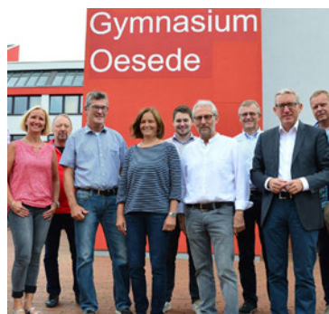
Besuch des Gymnasium Oesede mit der Kreistagsfraktion