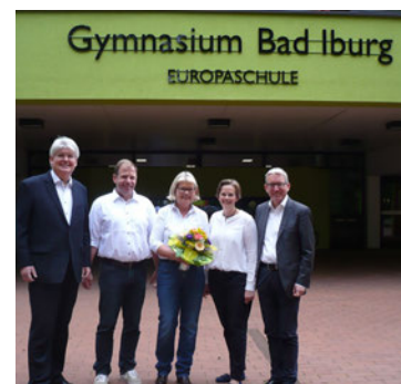
Besuch Gymnasium Bad Iburg