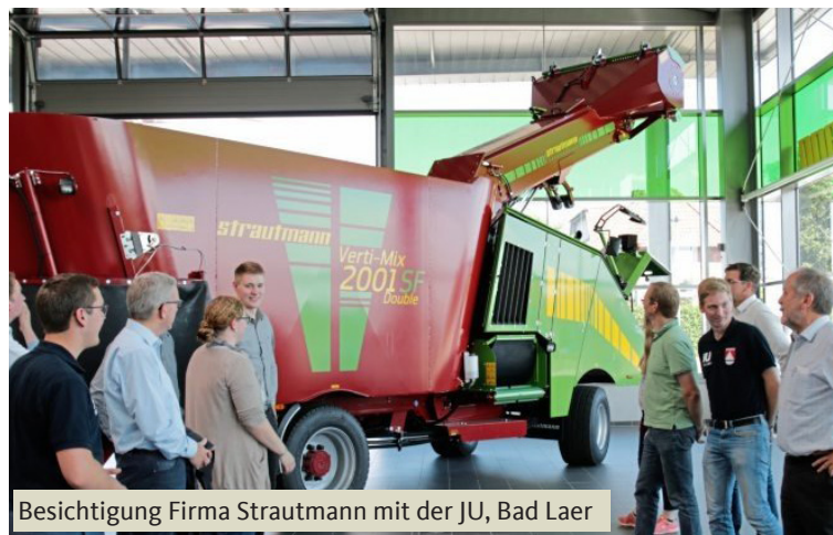
Besichtigung Firma Strautmann mit der JU, Bad Laer

Trotz Sommerferien war ich in den vergangenen Wochen viel im Wahlkreis unterwegs. Mir sind die persönlichen Termine und Gespräche vor Ort sehr wichtig, weil im Dialog gute Ideen entstehen. Denn Politik ist für die Menschen da und nicht umgekehrt. Zuhören und hinsehen, das will ich auch in den kommenden fünf Jahren gerne für die Bürgerinnen und Bürger im Süden von Osnabrück tun. Und mithelfen, Probleme zu lösen statt nur darüber zu diskutieren.