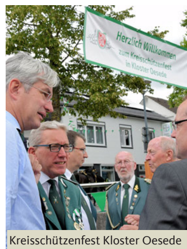
Kreisschützenfest Kloster Oesede