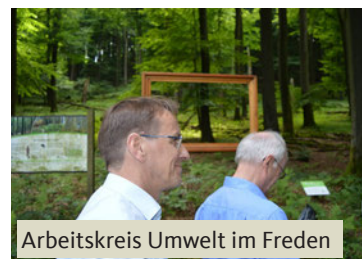
Arbeitskreis Umwelt im Freden

Weitere Informationen und Termine finden Sie auf: www.martinbaeumer.de oder auf den Social-Media-Kanälen