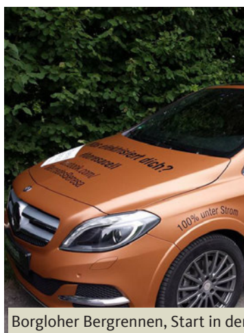
Borgloher Bergrennen, Start in der E-Klasse