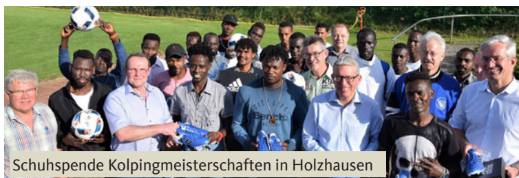
Schuhspende Kolpingmeisterschaften in Holzhausen